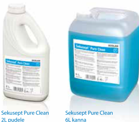
Sekusept Pure Clean 2L pudele

Sekusept Pure Clean var tikt izmantots zemā koncentrācijā diapazonā no 0,3% (3ml / L) līdz 1% (10ml / L), kas nozīmē, ka vienam ciklam nepieciešams mazāk produkta.