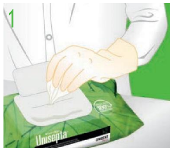
1 Izņemiet salveti no iepakojuma.

Pārliecinieties, ka ir valkāti atbilstoši cimdi.