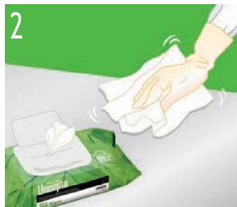
2 Uzlieciet salveti uz apstādājamās vietas